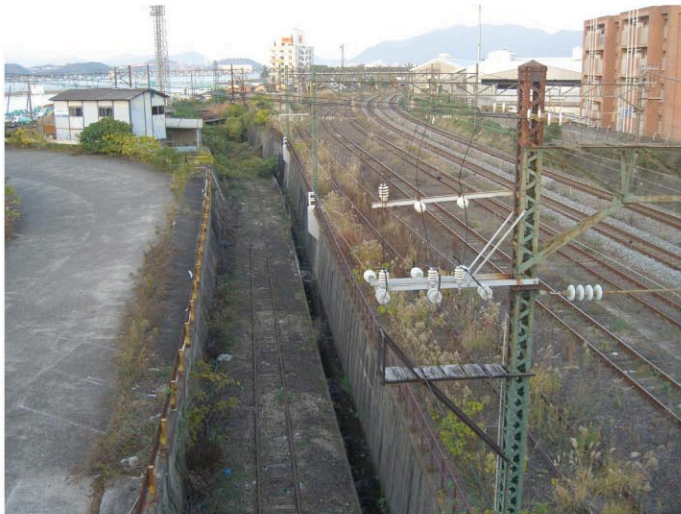
東小倉駅構内に入る陸橋上から見た、旧高浜ヤードへの連絡線廃止跡。 線路はこの先、鹿児島本線上り線との交差したところで無くなっている。