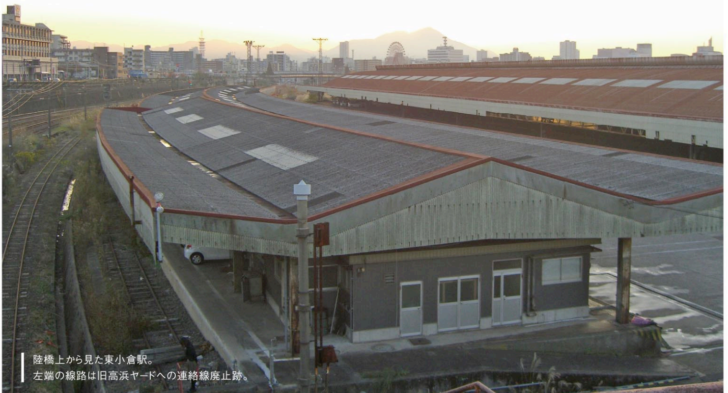
陸橋上から見た東小倉駅。 左端の線路は旧高浜ヤードへの連絡線廃止跡。