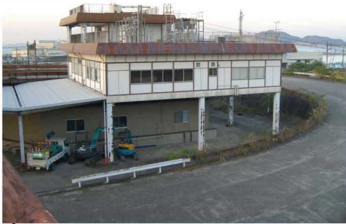
旧東小倉駅舎。 カートレインに乗車するお客様の待合室としても使用されていた。