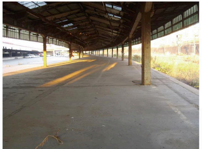
長く弧を描いた、南側ホーム。 かつてレムフやワキなど貴重な貨車が廃車留置されていた。 一部の貨車は埼玉県の大宮鉄道博物館へ保存されている。