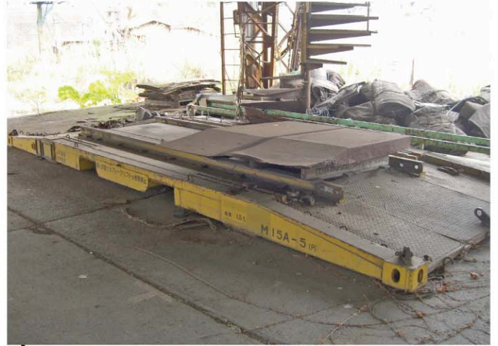
M15A形式の無蓋廃コンテナ。 現存数は僅か。