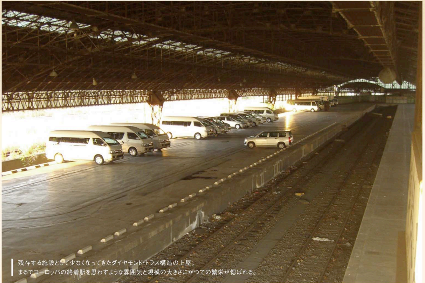
残存する施設として少なくなってきたダイヤモンド・トラス構造の上屋。 まるでヨーロッパの終着駅を思わせるような雰囲気と規模の大きさにかつての繁栄が偲ばれる。